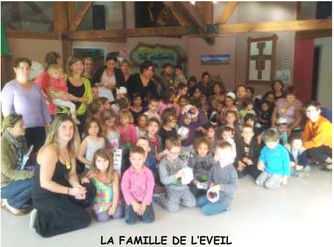
LA FAMILLE DE L'EVEIL